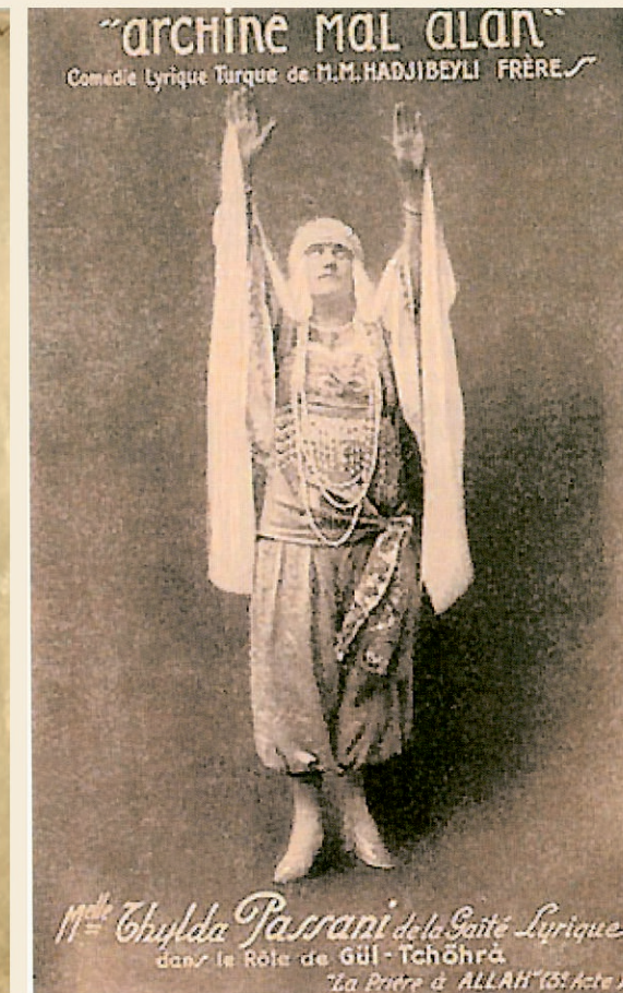
L'affiche Arshin Mal Alan, Théâtre Femina, Paris, 1925