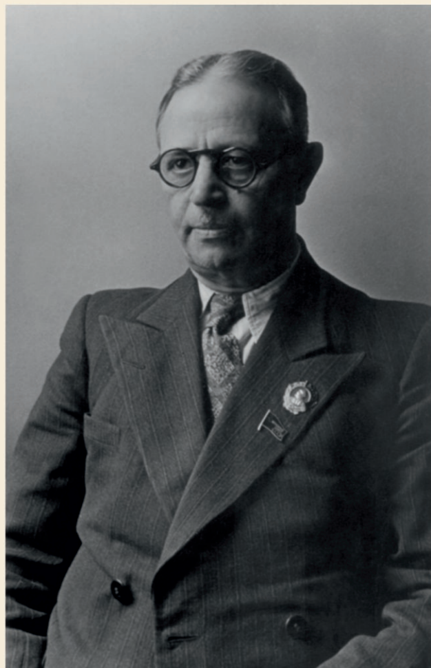
Uzeyir Hadjibeyli (Hadjibeyov) (1885-1948)